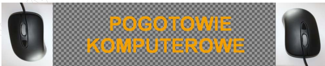
Obraz 2. Baner z przezroczystością – plik baner2