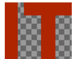
Obraz 1. Logo