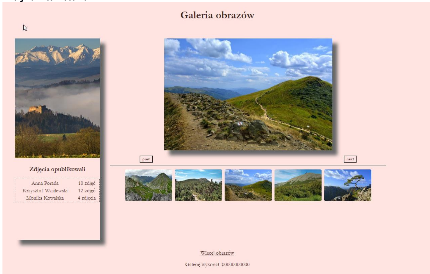
Obraz 2. Witryna internetowa