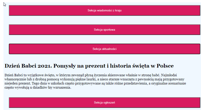
Obraz 3b. Otwarty artykuł sekcji aktualności