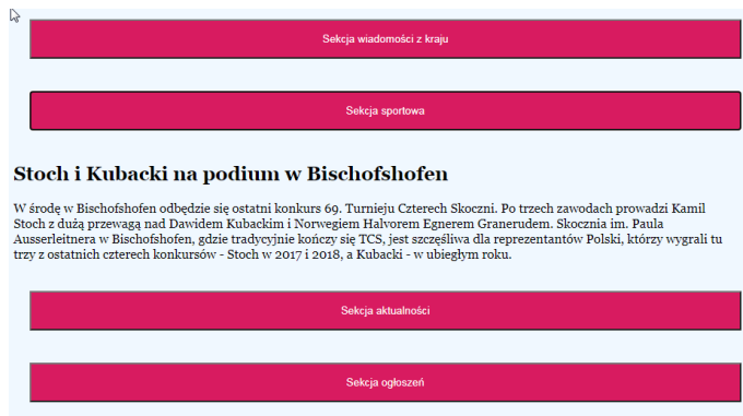
Obraz 3a. Otwarty artykuł sekcji sportowej