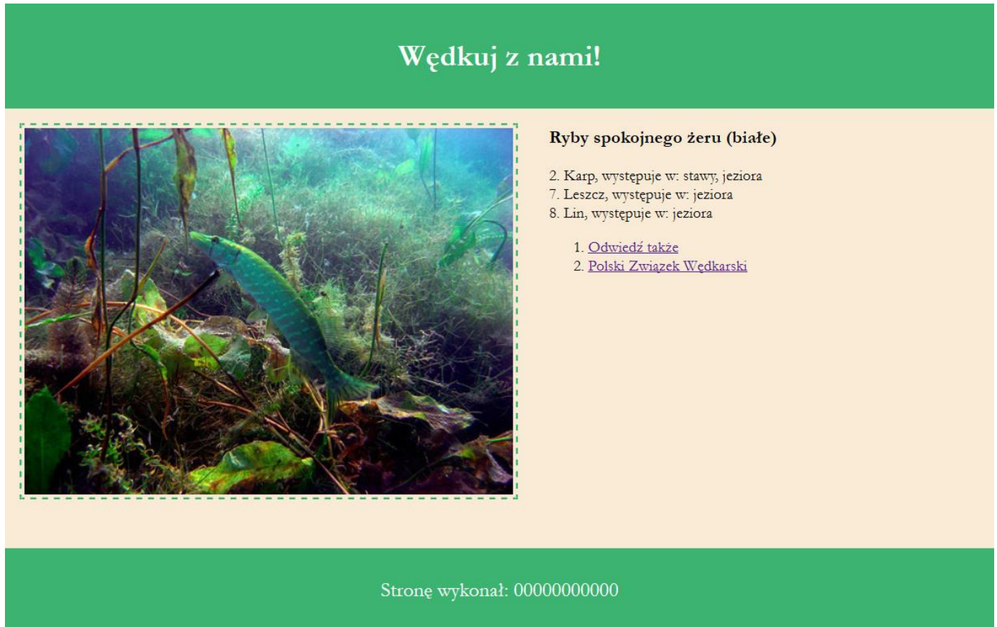
Obraz 2. Witryna internetowa