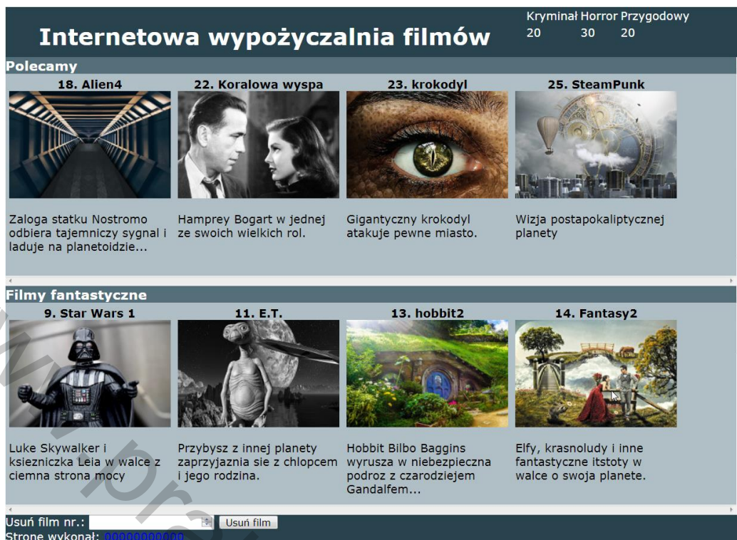
Obraz 2. Witryna internetowa